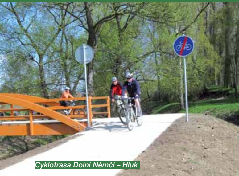
Cyklotrasa Dolní Němčí – Hluk