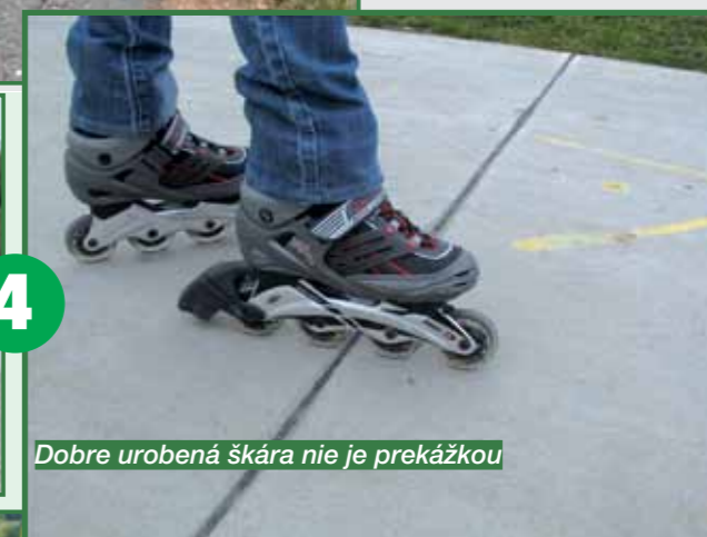
Dobre urobená škára nie je prekážkou