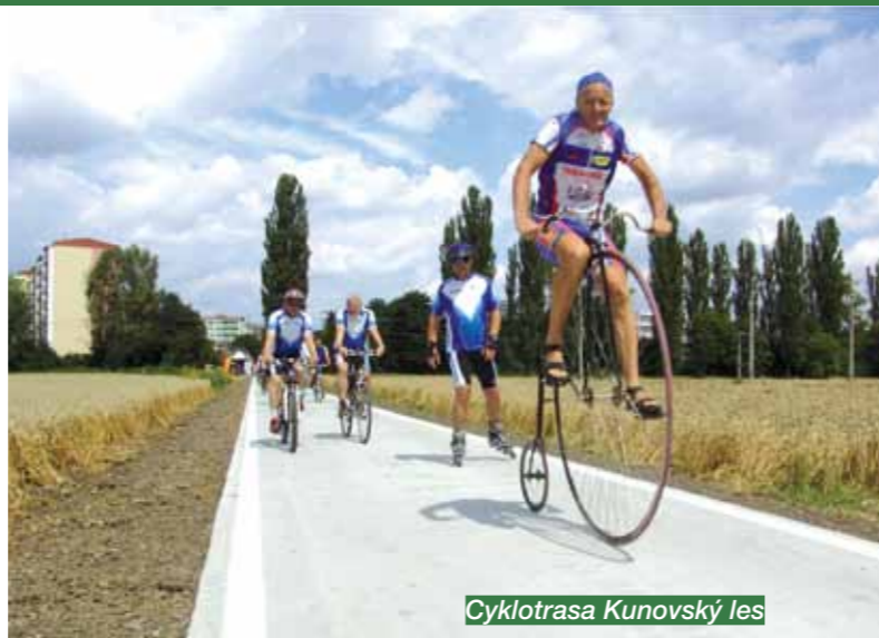
Cyklotrasa Kunovský les