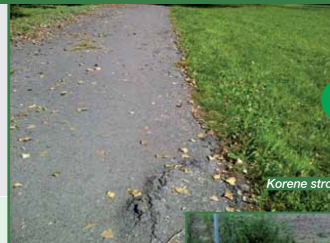
Korene stromov pod asfaltom

Betónové cyklotrasy nenarušia koreňové systémy okolitých drevín, takže povrch cyklotrasy zostáva bez vydutých a prepadnutých miest na povrchu cyklotrasy a aj bez výskytu širokých trhlín a prasklín spôsobených koreňmi stromov.