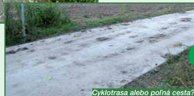
Cyklotrasa alebo poľná cesta?

Nakoľko cyklotrasy často križujú poľné cesty a poľnohospodárske komunikácie, nedá sa na križovatkách s týmito cestami vylúčiť občasný prejazd týchto strojov a mechanizmov. Kvalitné cyklocesty z betónu majú vysokú pevnosť a únosnosť, prejazd týchto strojov a mechanizmov ich nemôže narušiť.